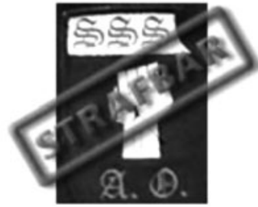
Skinheads Sächsische Schweiz