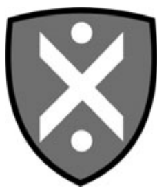
Das neue Logo