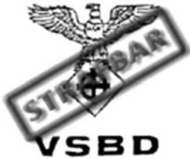
Volkssozialistische Bewegung Deutschlands/ Partei der Arbeit (VSBD/PdA)