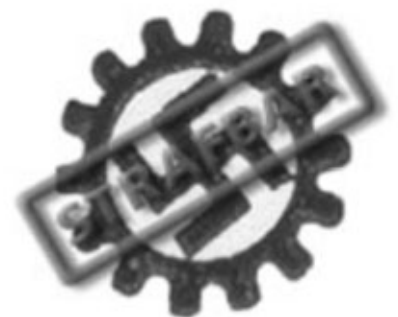
Deutsche Arbeitsfront (DAF)