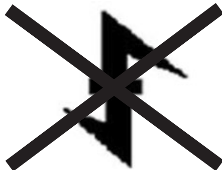
Junge Front (JF)

Beachte: Nicht die sog. „Odalrune“ an sich ist strafbar, sondern nur das Zeichen in Verbindung mit dem BNS.