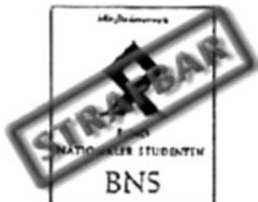
Bund Nationaler Studenten (BNS)

Beachte: Nicht die sog. „Odalrune“ an sich ist strafbar, sondern nur das Zeichen in Verbindung mit dem BNS.