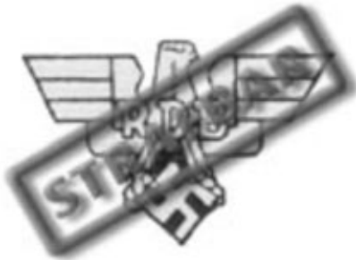
Reichsbund der deutschen Beamten (RDB)