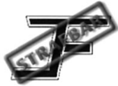
Direkte Aktion Mittelddeutschland (JF)