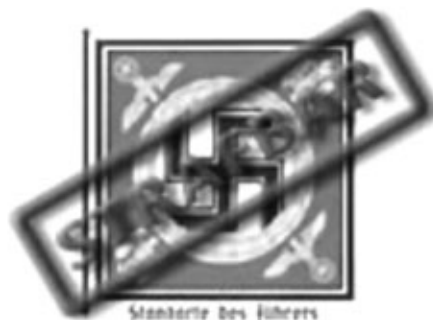
Standarte des Führers