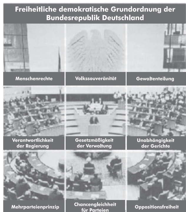
Aus: Broschüre „Bundesamt für Verfassungsschutz – Aufgaben Befugnisse, Grenzen“