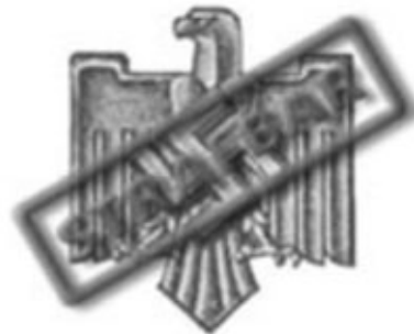
NS-Reichsbund für Leibesübungen