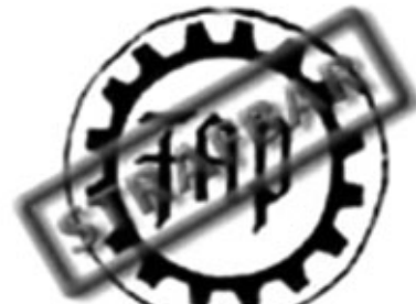
Freiheitliche Deutsche Arbeiterpartei (FAP)